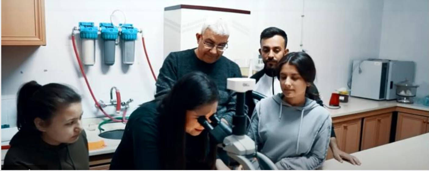
(Bitkisel Analiz Laboratuvarı)