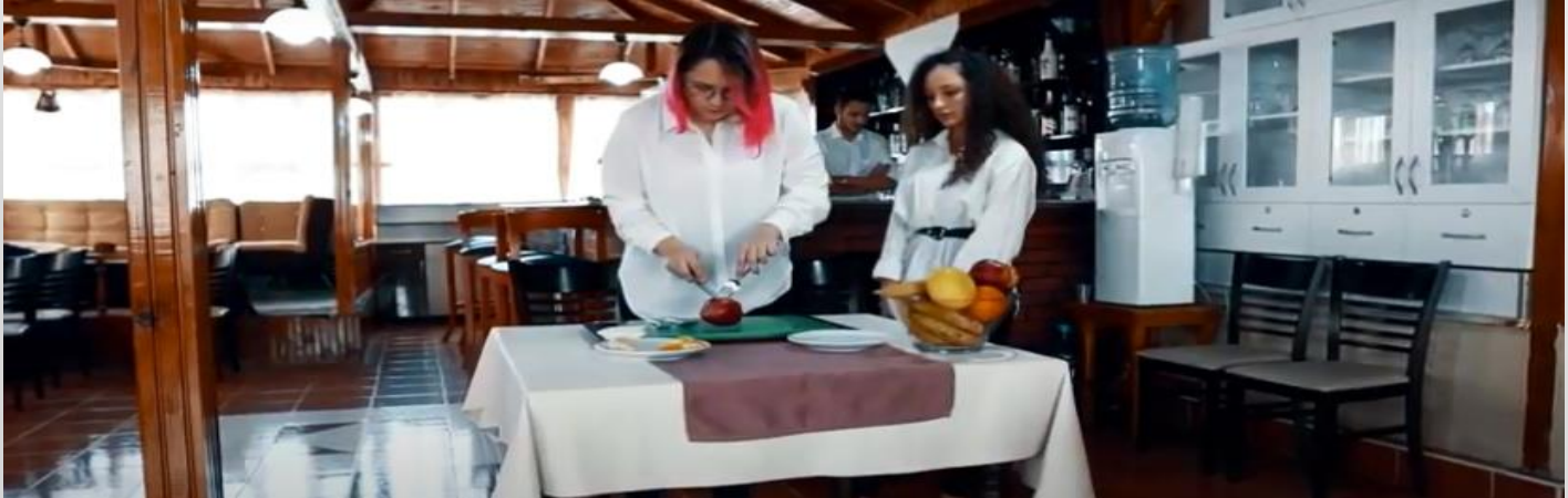
(Servis Uygulama Atölyesi)