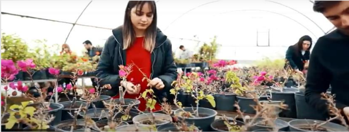
Peyzaj ve Ss Bitkileri Yetiřtiricilięi Programı Bitki retim Seraları