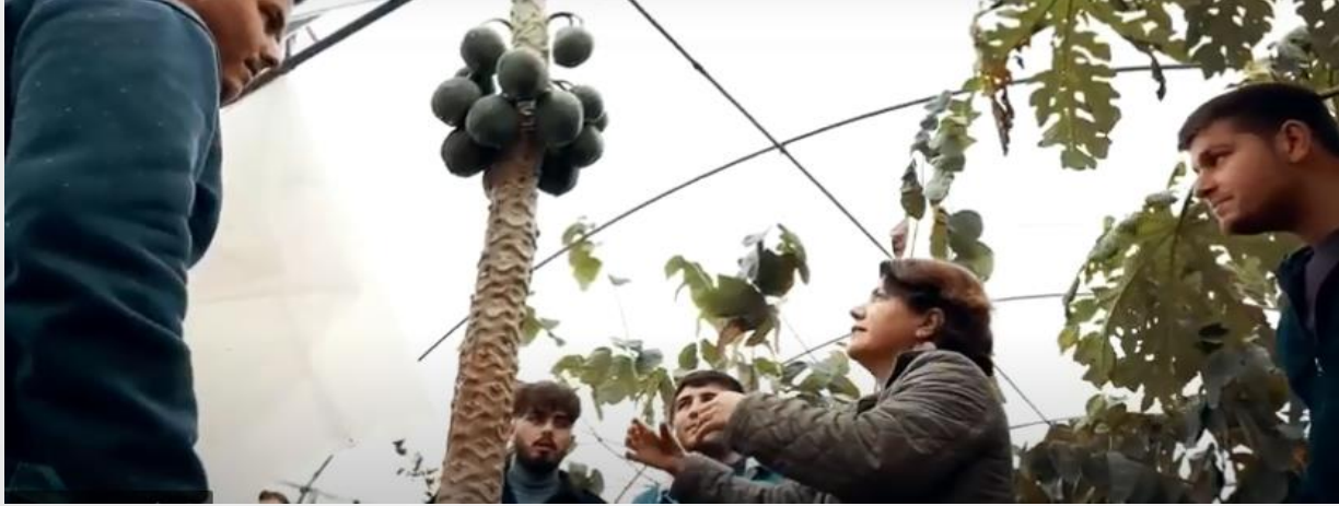
Bahe Tarımı Programı Uygulama Seraları